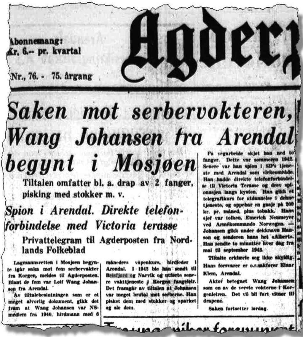
Leif J. fra Øyestad ble etter krigen dømt til livsvarig tvangsarbeid.