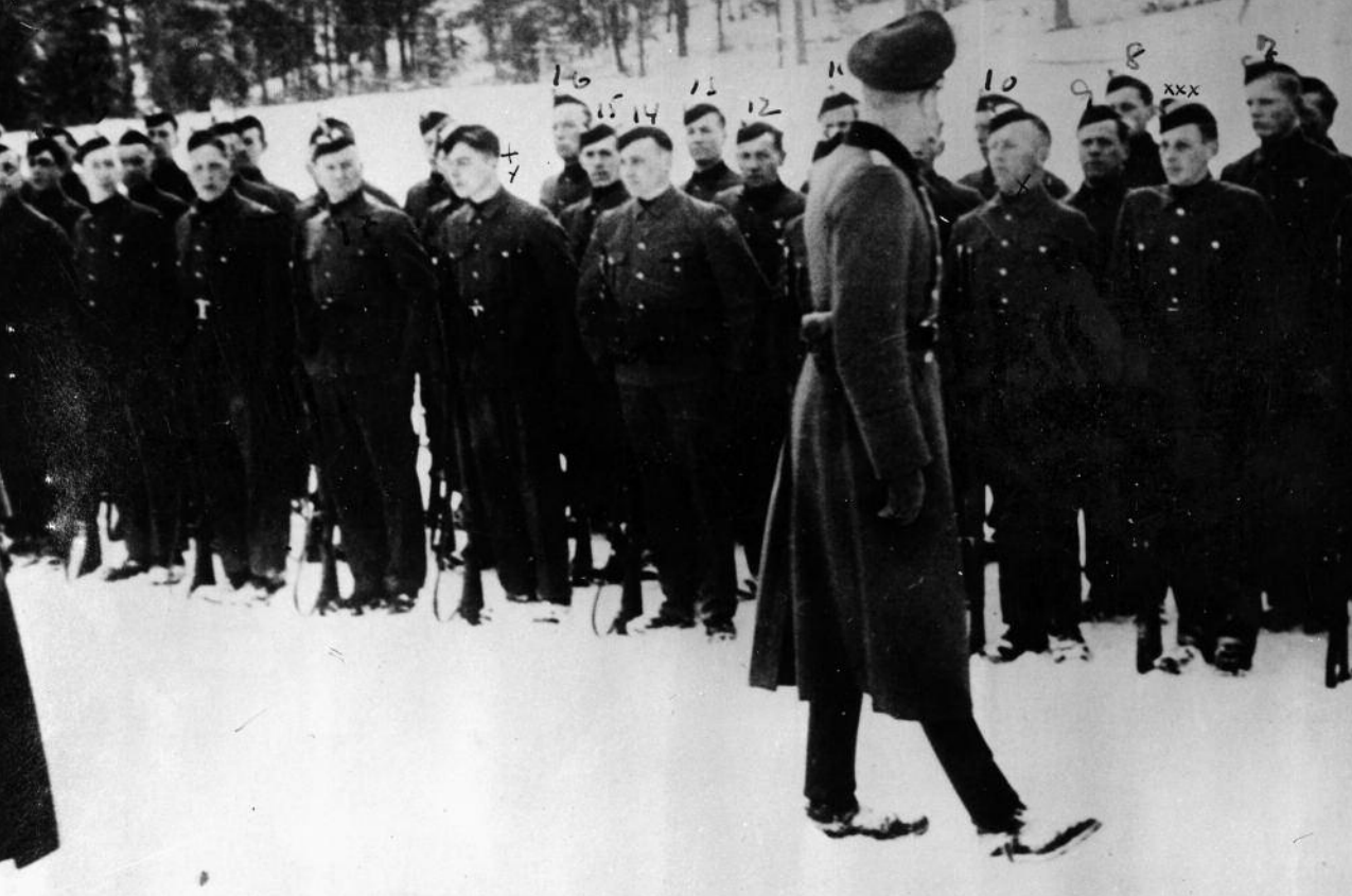
Den norske vaktbataljonen under opplæring i Halden i 1942.